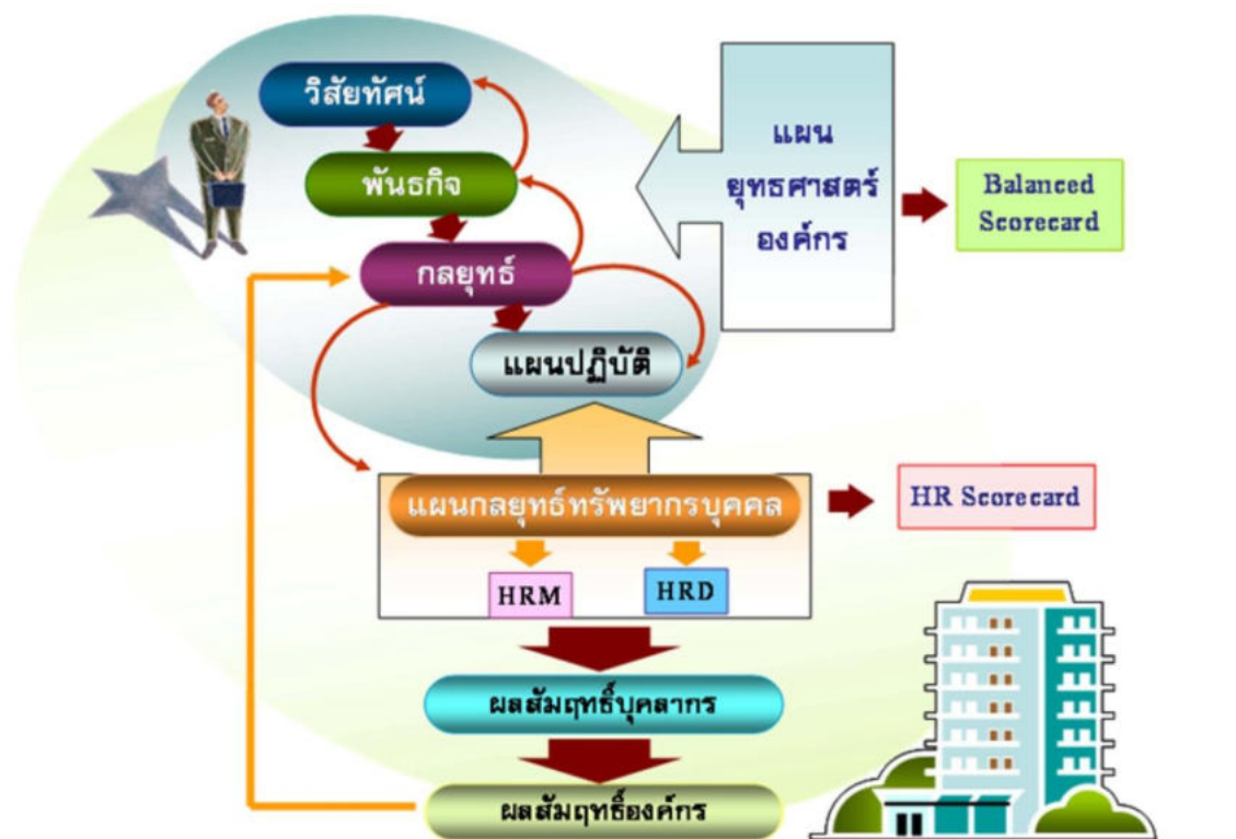
ภาพที่ ๒ ความเชื่อมโยงของผลสัมฤทธิ์ที่เกิดจากแผนกลยุทธ์การบริหารทรัพยากรบุคคลต่อผลสัมฤทธิ์ขององค์กร